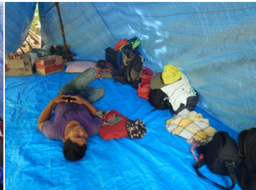
provizorní bydlení, které si ochranáři postavili na ostrově Bilang-bilangan